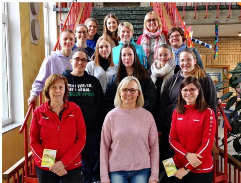
Teilnehmerinnen beim Turn10-Lehrgang